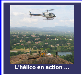
L'hélico en action ...