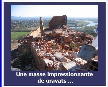
Une masse impressionnante de gravats ...