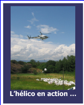
L'hélico en action ...