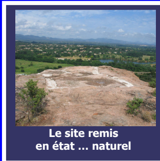
Le site remis en état ... naturel