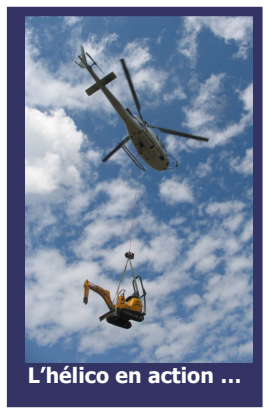
L'hélico en action ...