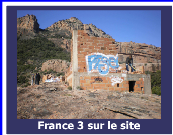
France 3 sur le site