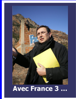
Avec France 3 ...