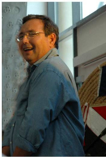
A Roquebrune, dans la salle Régis à la Bouverie pour les 30 ans de la Compagnie de Tir à l'Arc ....

Depuis novembre 1995, un conseiller général sur le terrain et présent aux manifestations organisées sur son canton ! (2)