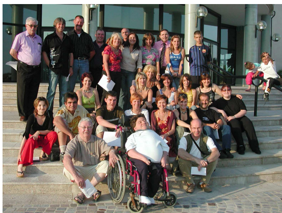
A Puget, avec la troupe des « Z'Enfoirés » sur le parvis de l'Espace Victor HUGO, un soir de répétition en 2006.