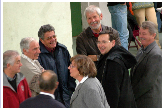
Au Muy, lors de la remise des prix de Concours Départemental de Tir à l'Arc, avec Mme la Présidente et les Adjointes et Conseillers Municipaux ...