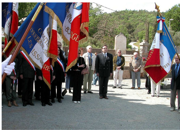
A Roquebrune, devant le Monument aux Morts, lors de la Journée de la Déportation ...

Depuis novembre 1995, un conseiller général attaché au devoir de mémoire et assidu aux commémorations ... sur son canton !