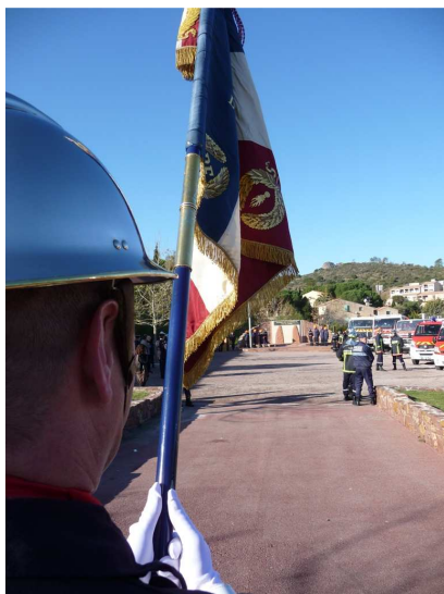
A Roquebrune, lors de la cérémonie de la Ste Barbe ....

Depuis novembre 1995, un conseiller général attaché au devoir de mémoire et assidu aux commémorations ... sur son canton !