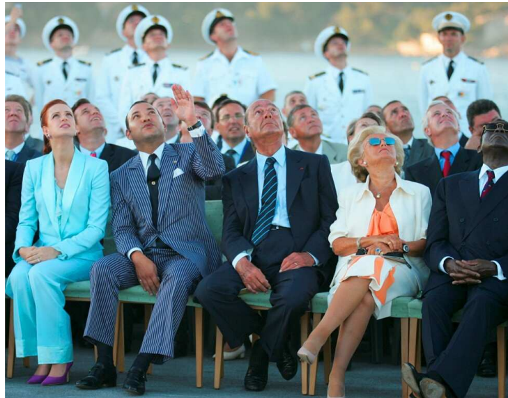
A Toulon, le 15 août 2004 pour le 60 ème anniversaire du Débarquement en Provence, sur le pont du porte-avions Charles De Gaulle, lors de la revue navale, derrière le Président Jacques CHIRAC et son épouse, la Reine et le Roi du Maroc, pendant le passage de la Patrouille de France ...