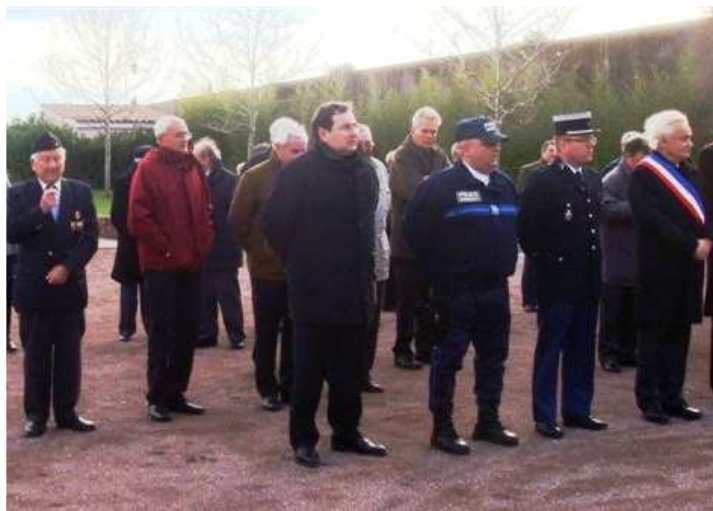
A Roquebrune, par un froid glacial ... Devant le Mémorial des Combattants ... Instants de recueillement aux cotés des autorités civiles et militaires ...