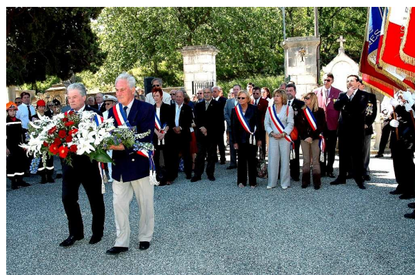
A Roquebrune, devant le Monument aux Morts, durant d'un dépôt de gerbe ... Lors la commémoration du 15 août 1944 ... Avant de se recueillir devant la stèle des parachutistes ...